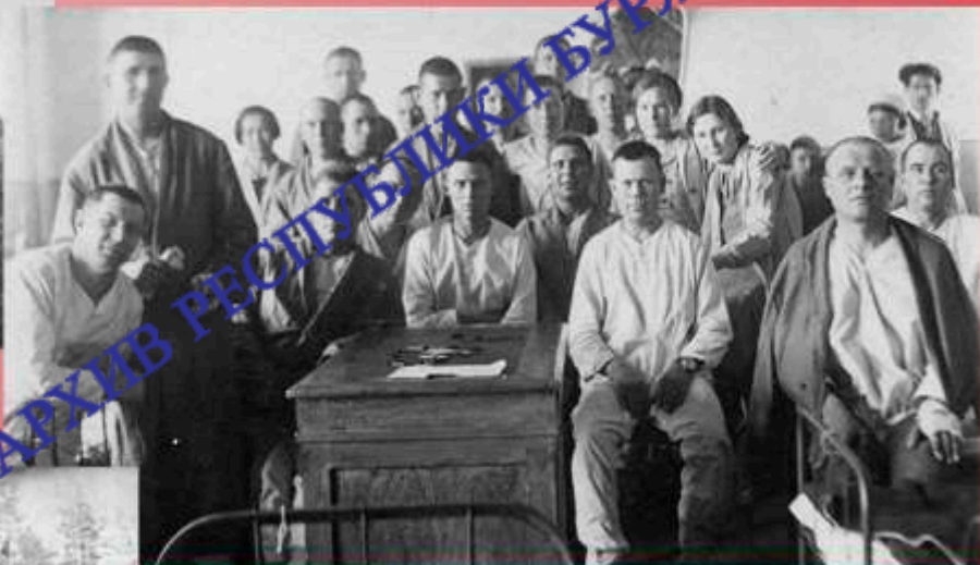
Госпиталь. Подшефная палата № 17 с коллективом Центрального государственного архива. г. Улан-Удэ. 8 марта 1942 г.