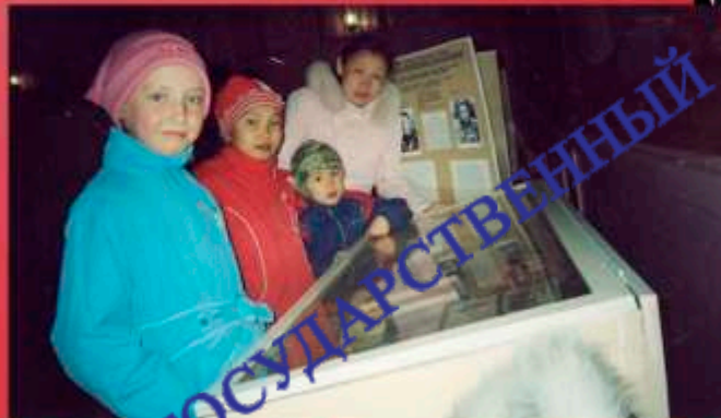
На выставке архивных документов, посвященной Победе в Великой Отечественной войне. с. Багдарин. 9 мая 2008 г.