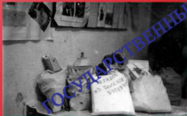
Подарки для фронта от коллектива Центрального государственного архива. г. Улан-Удэ. 1942 г.