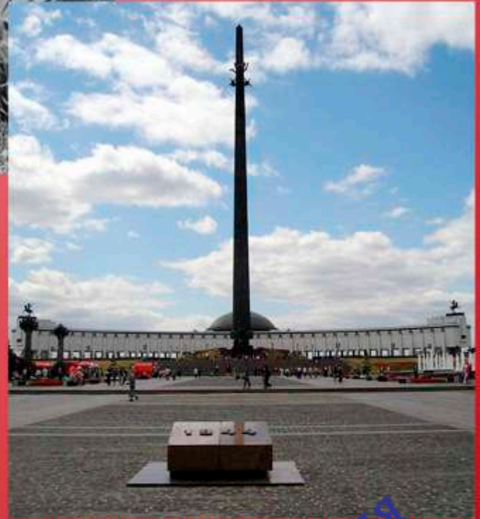
Мемориал Победы на Поклонной горе, Москва