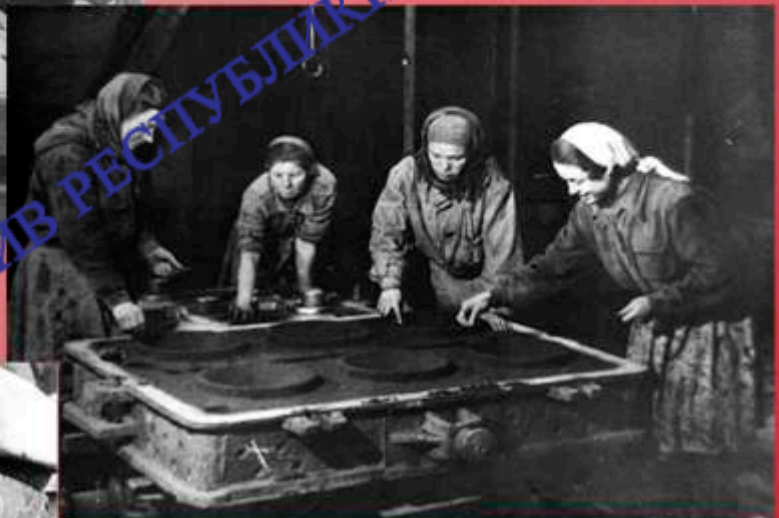
Формовщицы чугунолитейного цеха. ПВЗ. 1943 г.