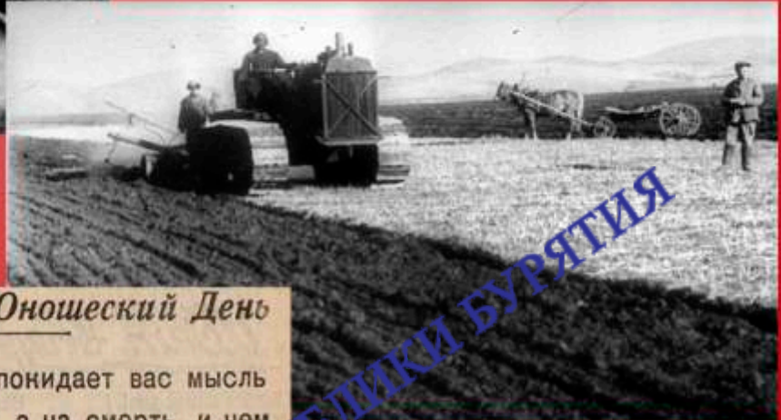
Труд во славу Родины. Женщины-трактористки на пахоте