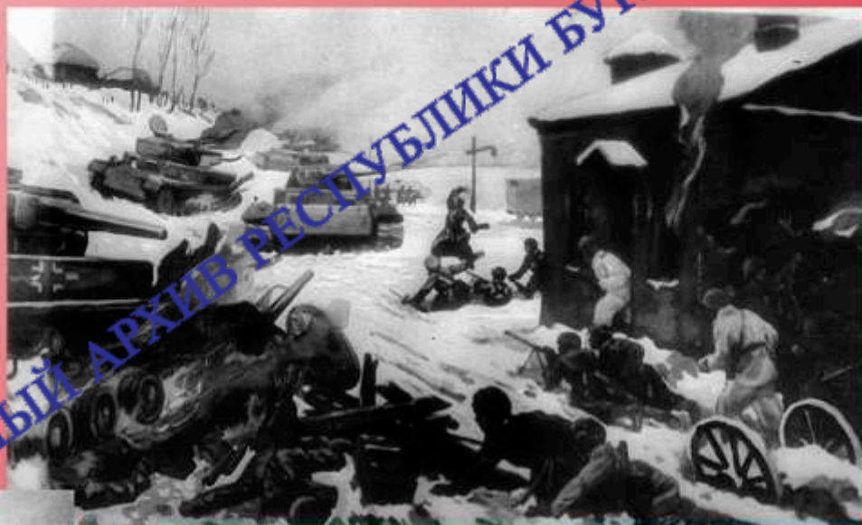
Подвиг 25 широнинцев. Здесь погиб И.М. Чертенков