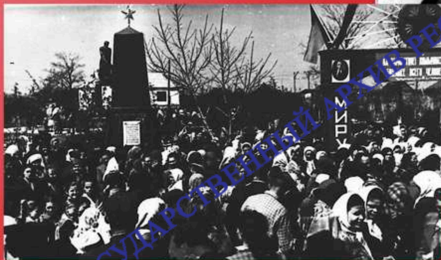
Жители с. Тарановка свято чтят память Героев Советского Союза. 9 мая 1960 г.