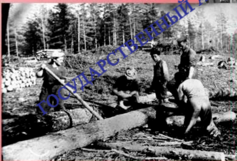
На субботнике. 1942 г.